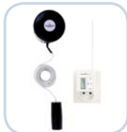
Czujnik poziomu i przecieku WatchmanSonic Plus