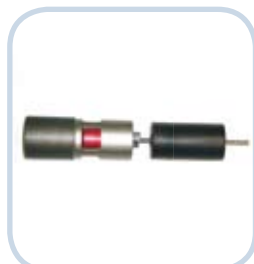
SpillStop - zabezpieczenie przed przepełnieniem zbiornika