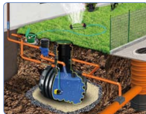
System GARDEN Eco II z przelewem do systemu kanalizacyjnego

Do podlewania trawnika wykorzystuje się standardowe węże ogrodowe oraz naziemne zraszacze dostępne w punktach ogrodnich. Systemy ogrodowe obejmują: kompletny zbiornik wyposażony w filtr i przelew, zatapialną samozasysającą pompę jednofazową wyposażoną w automatykę sterującą zamocowaną w zbiorniku, zakończoną poborem z sitkiem oraz niezależną od zbiornika okrągłą skrzynkę ogrodową.