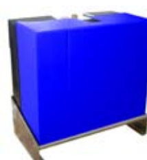
Centrala Matrix Complex