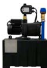
Centrala Matrix Standard