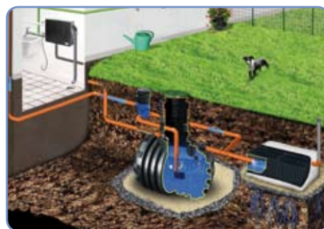
System HOUSE Complex II z przelewem do systemu rozsączającego

Systemy HOUSE Complex służą do magazynowania, a następnie wykorzystania wody deszczowej zarówno w pomieszczeniu, jak i na zewnątrz do celów bytowo-gospodarczych takich jak: spłukiwanie WC, pranie, sprzątanie oraz podlewanie trawnika. Systemy mogą być wykorzystywane przez cały rok. Składają się z kompletnego zbiornika z pokrywą, filtrem, poborem wody i przelewem oraz umieszczonej w pomieszczeniu technicznym budynku centrali sterującej wyposażonej w pompę oraz niezbędne akcesoria umożliwiające pobór wody ze zbiornika i wprowadzenie jej do niezależnej instalacji wodociągowej (WC, pralka, sprzątanie i podlewanie). W przypadku okresowego braku wody deszczowej w zbiorniku, instalacja jest automatycznie dopełniana wodą wodociągową. Należy pamiętać, iż w przypadku systemów HOUSE Complex konieczne jest zaprojektowanie i wykonanie osobnej instalacji wodociągowej wykorzystującej deszczówkę, a więc decyzję o zainstalowaniu systemu domowo-ogrodowego należy podejmować już na etapie projektowania obiektu mieszkalnego.