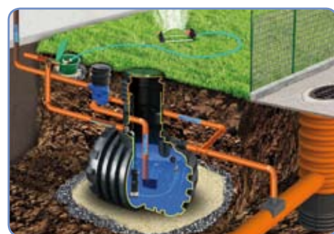
System GARDEN Complex II z przelewem do systemu kanalizacyjnego

Systemy GARDEN Complex służą do magazynowania, a następnie wykorzystania wody do podlewania trawnika w okresie wiosna – jesień. Oprócz tego, wodę można też używać do innych celów takich jak: mycie samochodu, prace porządkowe dookoła domu itp. Woda spływająca z dachu systemem rynnowym poprzez rurę spustową doprowadzana jest rurami ułożonymi pod ziemią do zbiornika podziemnego. Następnie na filtrze zainstalowanym w rurze wznoszącej zbiornika (system GARDEN Complex I) lub filtrze podziemnym zainstalowanym przed zbiornikiem (system GARDEN Complex II) odbywa się jej mechaniczne oczyszczenie z zabrudzeń, a czysta woda spływa do zbiornika. Nadmiar wody, który może okresowo dopływać do zbiornika, odpływa poprzez automatyczny przelew poza zbiornik. Do podlewania trawnika wykorzystuje się standardowe węże ogrodowe oraz naziemne zraszacze dostępne w punktach ogrodnich. Systemy ogrodowe obejmują: kompletny zbiornik wyposażony w filtr i przelew, zatapialną pompę wielostopniową jednofazową zamocowaną w zbiorniku, zakończoną poborem z sitkiem i pływakiem oraz niezależną od zbiornika skrzynkę ogrodową.